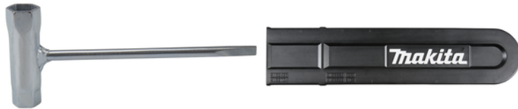
958501699 Combisleutel SW13/SW16-SL7x1,5