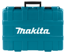
821717-0 Koffer kunststof haakse slijper