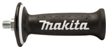
162264-5 Zijhandgreep anti-vibratie M14