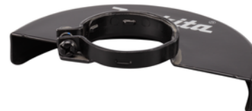
122889-7 Beschermpak 180mm afbramen