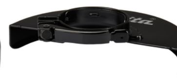
127713-9 Beschermpak 180mm afbramen