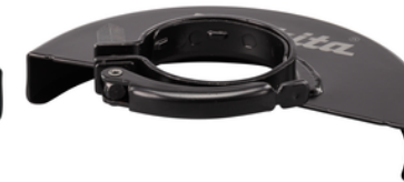
122846-5 Beschermpak 180mm afbramen