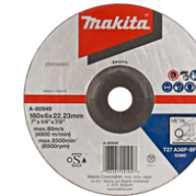
P-05860 Afbraamschijf 180x6,0mm staal