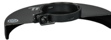
141P30-9 Beschermpak 180 mm afbramen