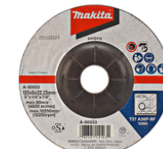
A-80933 Afbraamschijf Staal