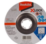
E-00393 Afbraamschijf Staal X-LOCK