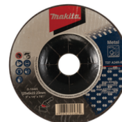
D-18465-20 Afbraamschijf Staal