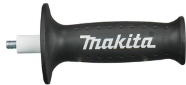
158237-4 Zijhandgreep softgrip M8