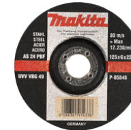
P-05848 Afbraamschijf 125x6,0mm staal