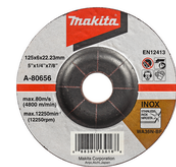
A-80656 Afbraamschijf RVS