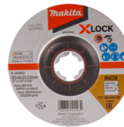
E-00402 Afbraamschijf RVS X-LOCK