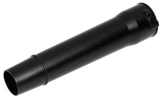
6709017010 Blaaspijp boven