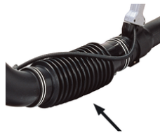
6989506900 Flexibele pijp