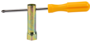
5019001000 Combisleutel SW19-PH2